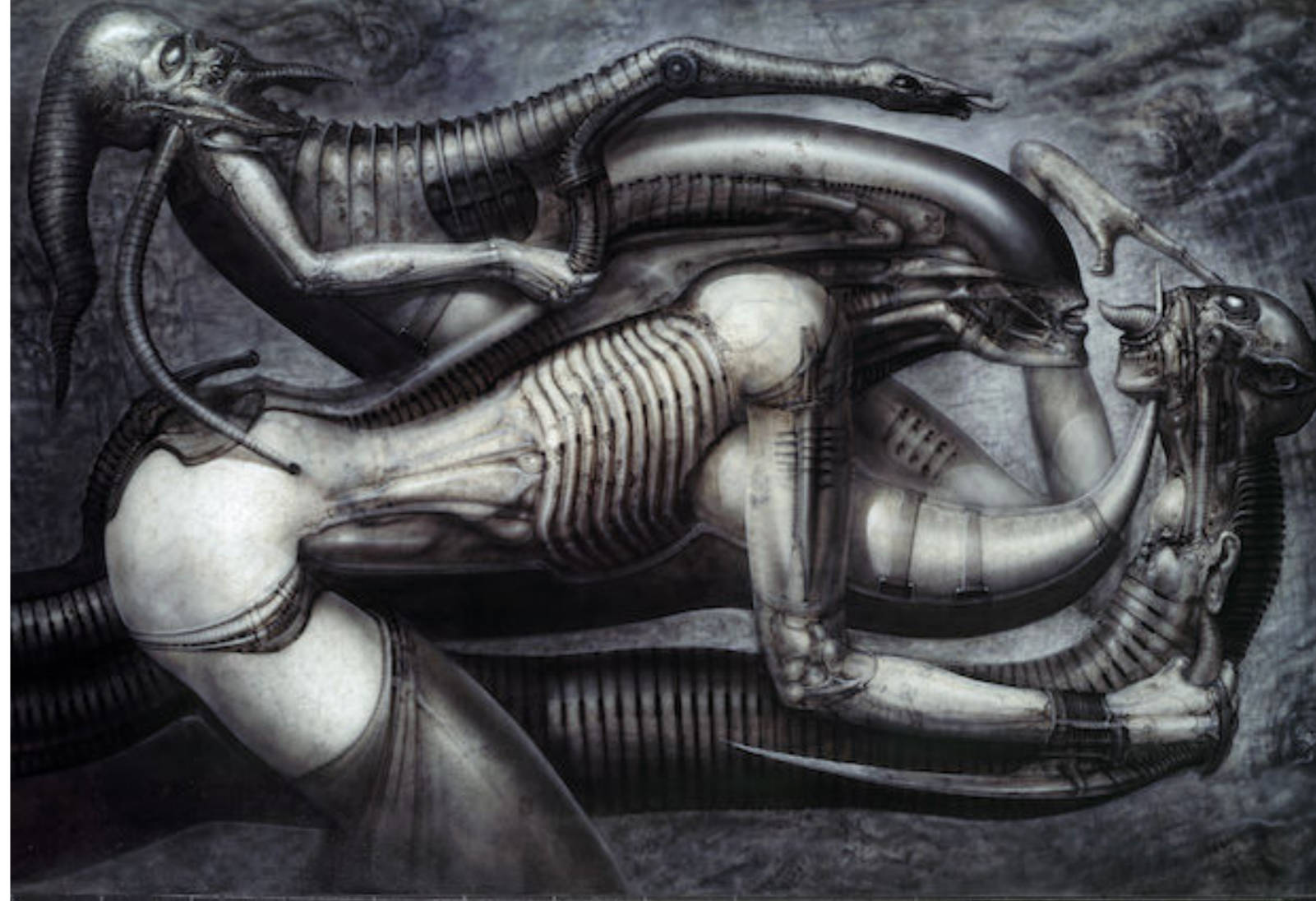
H.R. GIGER- Necronom V, 1976-1996, Sérigraphie

Horaires : Du mercredi au dimanche de 15h à 19h-Fermeture les lundi et mardi