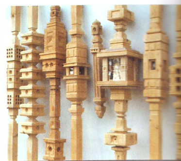
Stupas, 1997. Bois sculpté et pâte à papier, 220 x 15 cm.

► MUSÉE D'ART MODERNE DE COLLIOURE Ouverture de 10 h à 12 h et de 14 h à 18 h. Fermé le mardi d'octobre à mai Villa Pams, route de Port-Vendres, 66190 Collioure, Tél. 04 68 82 10 19 musee@collioure.net