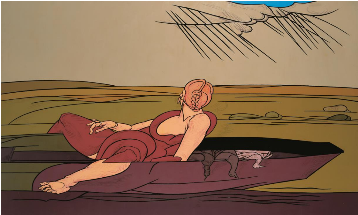
L'incantesimo del lago, 1984. Acrylique sur toile, 195 x 260 cm

A ce jour, Valerio Adami fait encore parler de lui dans le monde entier: il est représenté par la galerie Daniel Templon à Paris depuis 2004, une grande rétrospective a été organisée à la fondation Pomodoro de Milan en 2008, et il continue à participer aux biennales ainsi que d'organiser des expositions de ses œuvres.