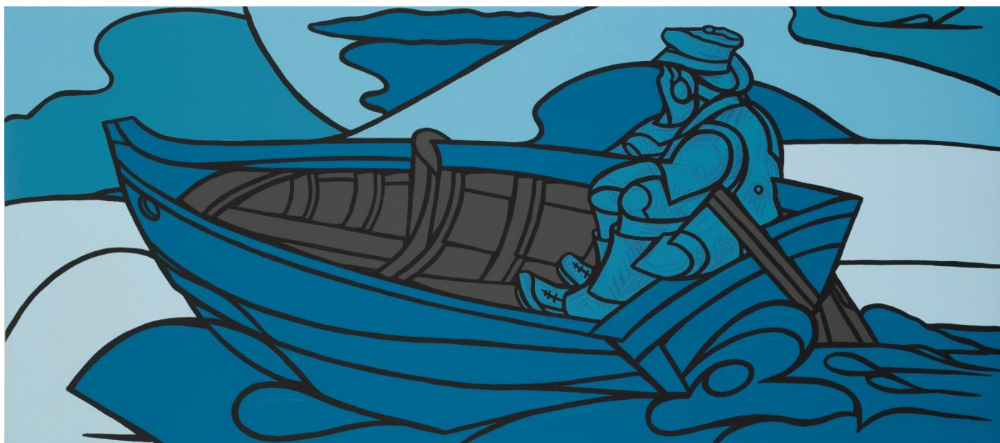
Studio per Il ponte, 2012. Acrylique sur toile, 65 x 147 cm

Commissaire de l'exposition Javier MOLINS