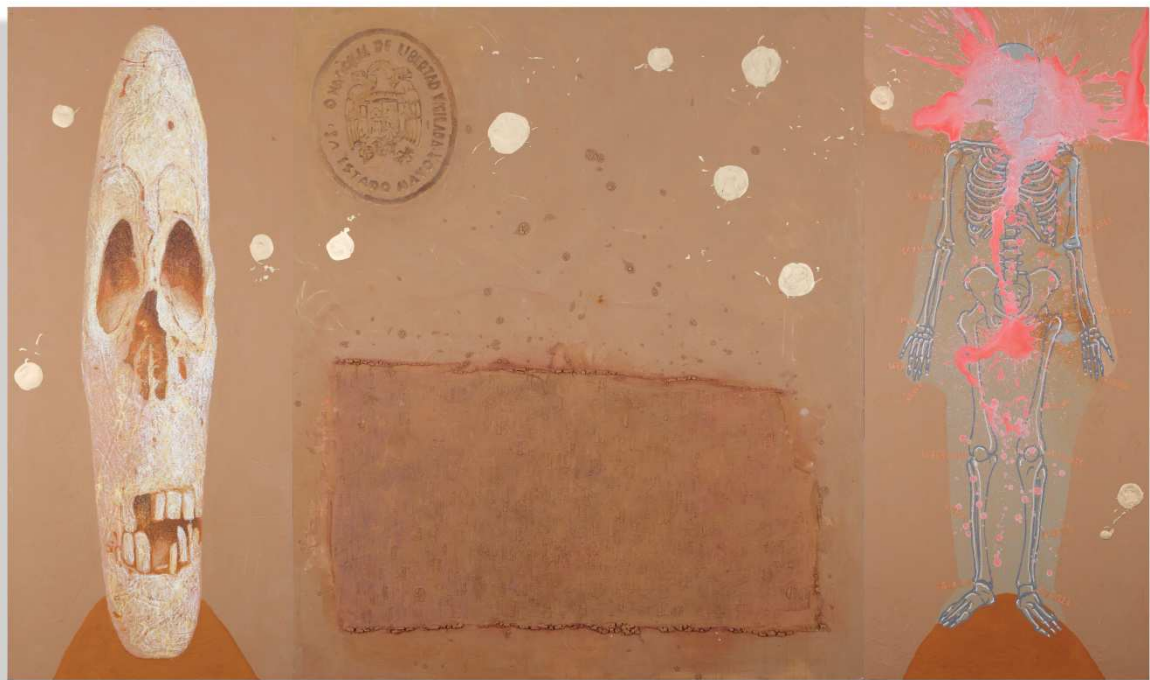
Série Les émotions (Fosse), 2015. Huile sur toile, 200 x 340 cm