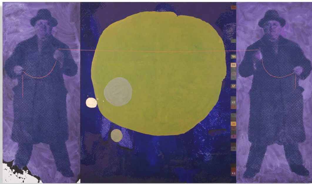
Série Les émotions (Violet), 2016. Huile sur toile, 200 x 340 cm