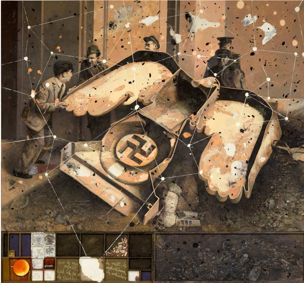
Les creux de l'aile, 2012. Huile sur toile, 276 x 300 cm