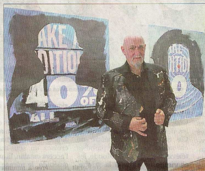
▶ CharElie Couture expose ses portraits intérieurs.

Connu pour ses chansons entrées dans le patrimoine culturel français, CharElie Couture y présente ses portraits intérieurs, très contemporains, réalisés en 2013 et 2014 à New-York. « Dans la pure tradition des portraits de la Renaissance, on présente le sujet avec son masque, c'est-à-dire avec ce qu'il donne à voir au monde. Ce n'est pas ma vision. J'ai choisi, autour de cette déclinaison de portraits, de mettre l'intérieur des personnages à l'exérieur. Je suggère l'histoire de l'âme. Conscience et inconscience, où on ne perçoit jamais rien dans son entièreté ». Inspirées par la ville, ces peintures sur carton, sur bois avec collage, sur toile avec collage et sur cartons